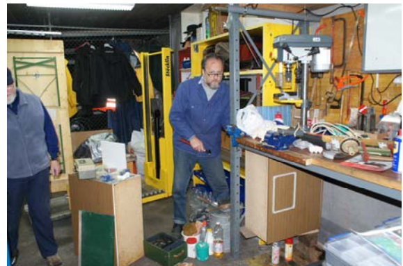
...und da waren noch:

besser wirkte. Dieser „Umbau“ wurde notwendig, weil wir die Lagermöglichkeiten im UG des Schulungsgebäudes wegen dessen Umbau verloren haben. In der Lokremise wurde ja bereits vor einigen Wochen ein neues Gestell eingerichtet, welches künftig einige der Bedienerwagen aufnehmen soll. Zugleich wurde auch mit der Entrümpelung der Remise begonnen und einige der Möbelstücke neu positioniert bzw. befestigt. Dieser Vorgang dürfte allerdings noch einige Nachmittage in Anspruch nehmen.