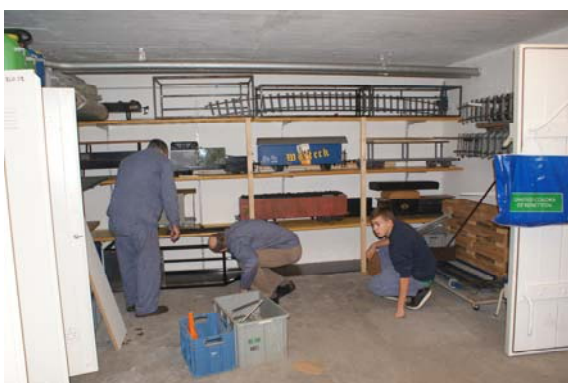
In diesem Keller wurde unter anderem ein für uns zweckdienlicher Kühlschrank aufgestellt. Die vorhandenen Regale wurden entrümpelt und neu bestückt, sodass dieser Raum schon nach kurzer Zeit deutlich

besser wirkte. Dieser „Umbau“ wurde notwendig, weil wir die Lagermöglichkeiten im UG des Schulungsgebäudes wegen dessen Umbau verloren haben. In der Lokremise wurde ja bereits vor einigen Wochen ein neues Gestell eingerichtet, welches künftig einige der Bedienerwagen aufnehmen soll. Zugleich wurde auch mit der Entrümpelung der Remise begonnen und einige der Möbelstücke neu positioniert bzw. befestigt. Dieser Vorgang dürfte allerdings noch einige Nachmittage in Anspruch nehmen.